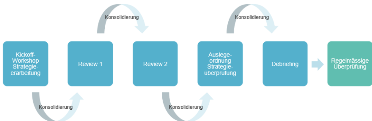
Abbildung 1: Vorgehen und Methodik (Zum Vergrössern anklicken)

Dabei wurden einerseits bestehende regelmässige Meetings um einen periodischen Strategie-Überprüfungsslot ergänzt, vor allem aber wurde ein Strategility-Board eingeführt, um den Überblick und die Fortschrittskontrolle zu gewährleisten. In einem Debriefing wurde schliesslich der GEVER-Strategieprozess zusammengefasst und die Strategie verabschiedet. Seither finden periodisch Überprüfungstermine statt.