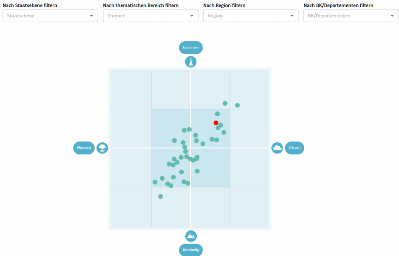
Abbildung 2: APP-Digitalisierungsmatrix (zum Vergrössern Anklicken)

Darüber hinaus werden die Ergebnisse in der APP-Digitalisierungsmatrix dargestellt, welche die Positionierungen in den Achsen physisch-virtuell und beständig-explorativ zeigt. Die eigene Positionierung innerhalb der Digitalisierungsmatrix kann mit der von anderen Verwaltungseinheiten verglichen werden. Durch Filter lassen sich die Vergleichskandidaten individuell eingrenzen.