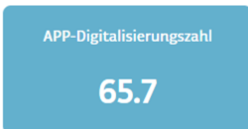
Abbildung 1: APP-Digitalisierungszahl

Die Ergebnisse werden als APP-Digitalisierungszahl ausgewiesen. Dadurch kann der Digitalisierungsgrad von verschiedenen Verwaltungseinheiten aller föderalen Ebenen verglichen werden. Die Kennzahl gibt dabei an, wie ausgeprägt der Digitalisierungsgrad einer Verwaltungseinheit ist und ermöglicht Benchmarking sowie eine kontinuierliche Überwachung und Bewertung ihrer Entwicklung über die Zeit.