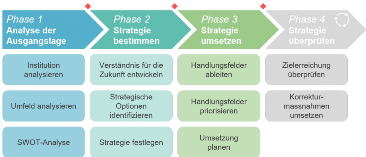
Abbildung 1: Auszug aus APP-Methodik «Strategieentwicklung» für soziale Institutionen

Zur Analyse der Ausgangslage wird die Innensicht der Institution berücksichtigt («Institution analysieren»). Dazu gehören beispielsweise die Bewohnenden, das Personal oder die Organisation. Weiter wird das Umfeld wie beispielsweise andere ähnliche Institutionen oder Behörden untersucht. Im Folgenden werden nur beispielhaft Faktoren der Umfeldanalyse vorgestellt.